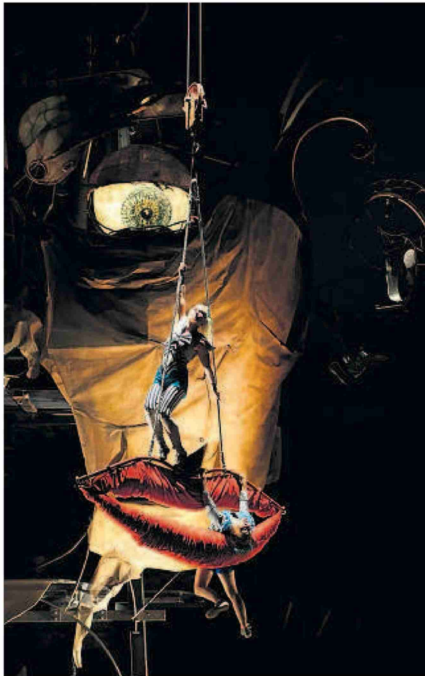
Bezaubernder Nouveau Cirque unter dem Auge des Zyklopen.

Themen-Nr.: 34.13 Abo-Nr.: 1090180 Seite: 24 Fläche: 45'670 mm 2